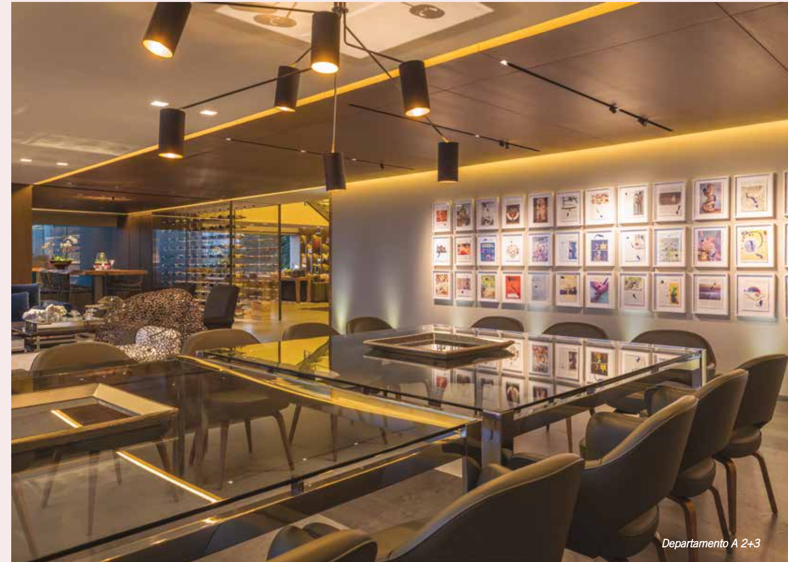
Departamento A 2+3

En la arquitectura interior, la Mezcalería Expendio Tradición es un ejemplo del desarrollo de un proyecto para otra marca. ¿Cómo se integra Ezequiel Farca a este tipo de proyectos (Aeroméxico, Habita, El Encanto) sin desaparecer? Las marcas se acercan a despachos de diseño para hacer este tipo de colaboraciones, ya que buscan un proyecto con cierta metodología y concepto. Nosotros, como despacho, aprendemos de ellos la técnica, nuevas tecnologías y estandarizaciones que complementan y aportan al proceso ya definido.