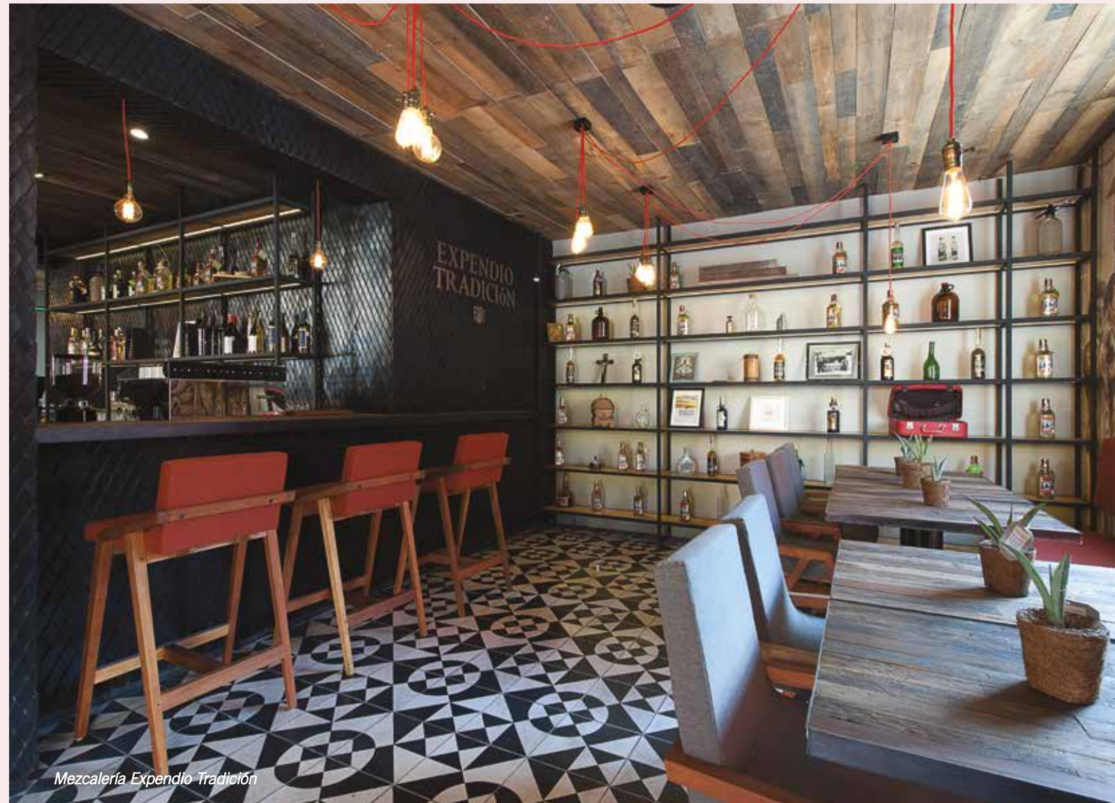
Mezcalería Expendio Tradición

Hay proyectos como Casa Barrancas que son remodelaciones, por lo tanto la envolvente ya está definida y hay que jugar con ella. Aquí lo interesante es la transformación que le puedes dar a un espacio introvertido con ciertas limitantes de cambio y crear un proyecto que no pierde su intimidad, pero se conecta directamente con su exterior. Es hacer énfasis en la distribución y crear espacios de contemplación abiertos al entorno. Esto es parecido a nuestros proyectos de arquitectura interior, donde el enfoque se halla por completo en el programa, pero con unas limitantes espaciales que son los muros exteriores previamente definidos por alguien ajeno. Es un reto diferente, ya que el programa y el espacio interior es lo que hace el proyecto aunque no pierda la intención de tener siempre un balance entre la dinámica que se va a generar en el interior y cómo va a comunicarse e interactuar con el exterior.