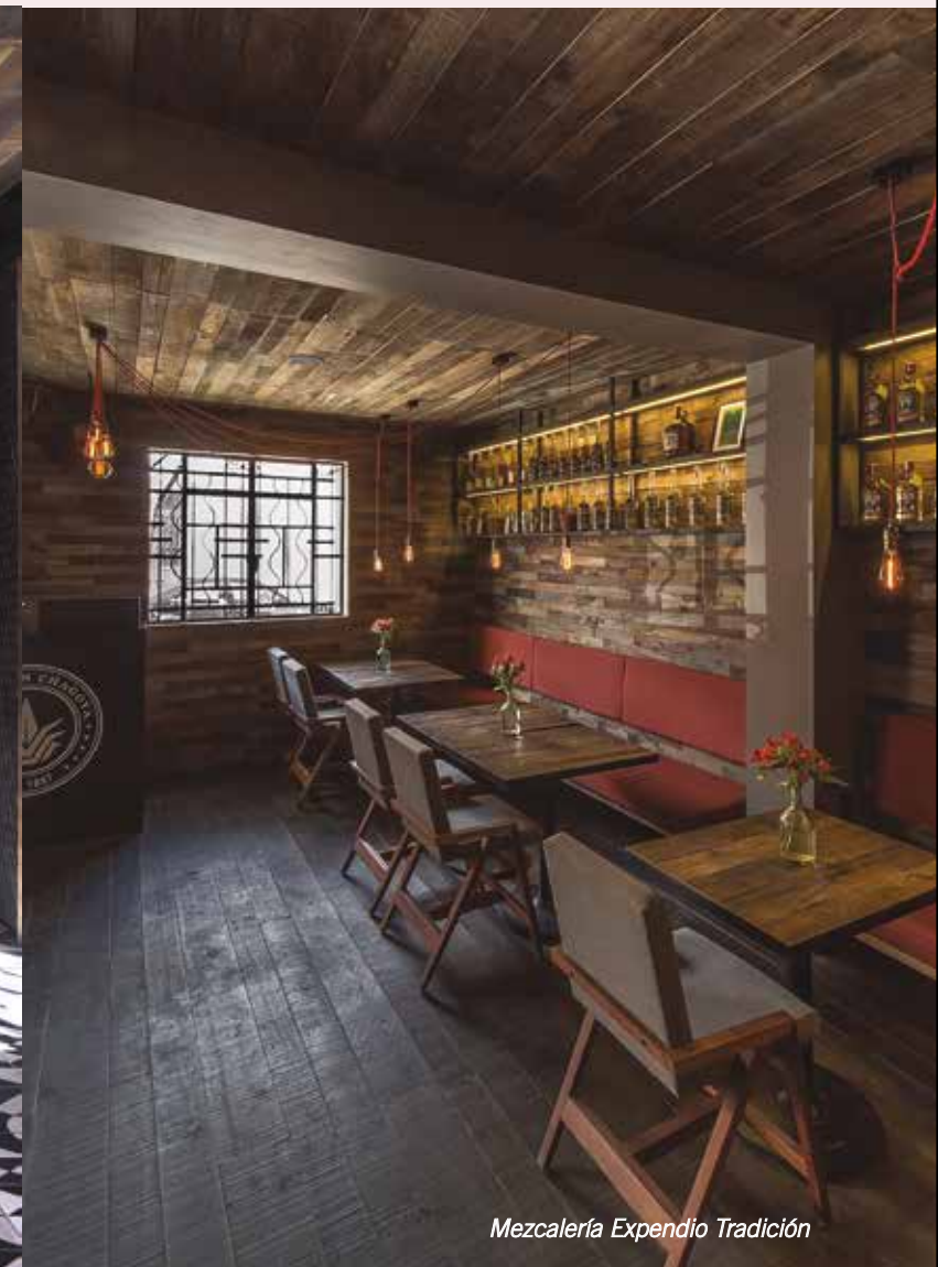
Mezcalería Expendio Tradición