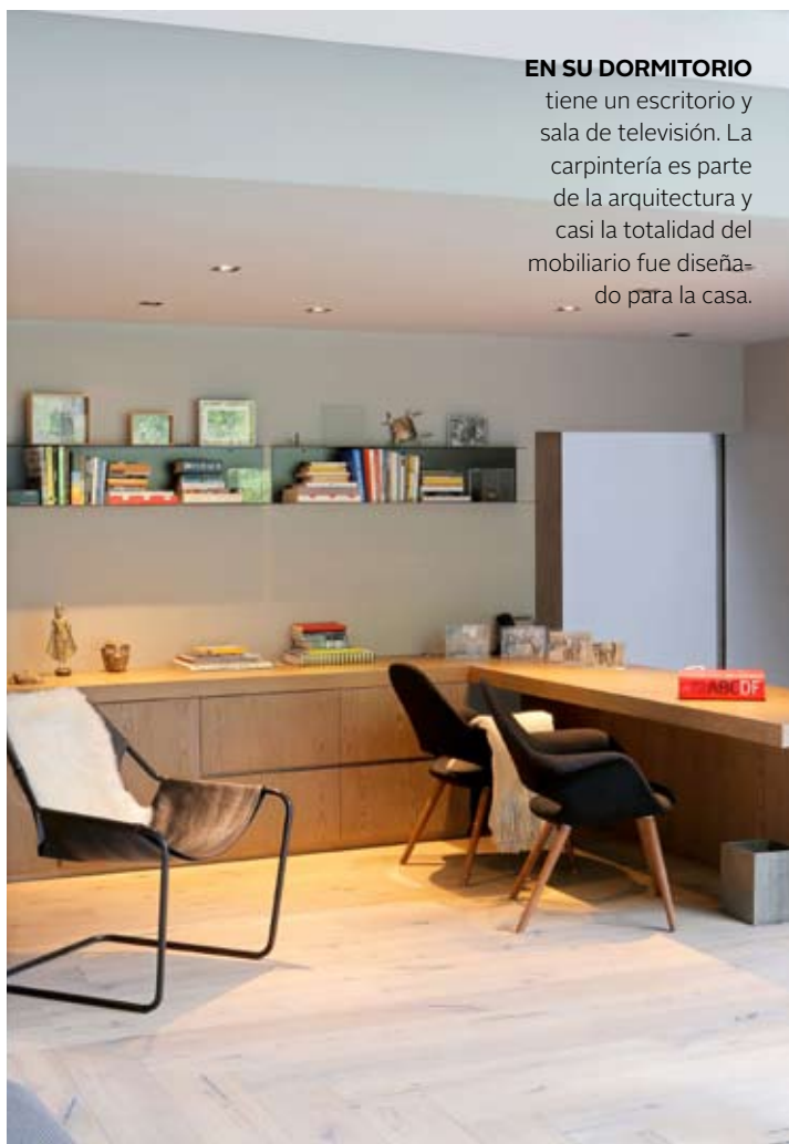
EN SU DORMITORIO tiene un escritorio y sala de televisión. La carpintería es parte de la arquitectura y casi la totalidad del mobiliario fue diseñado para la casa.