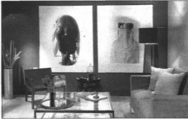
El libro está conformado por todo tipo de proyectos, incluyendo el diseño de interiores.